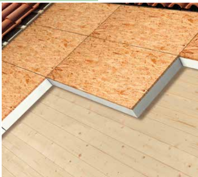
Isolamento per copertura a falda inclinata con struttura in legno