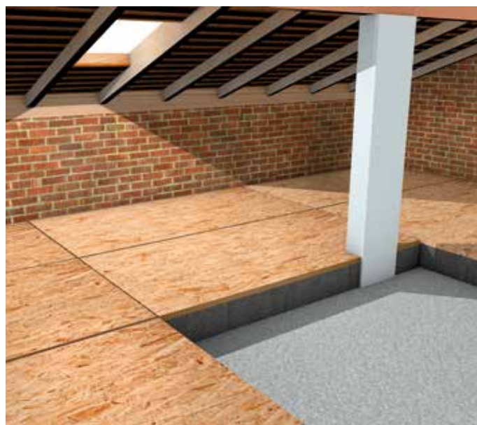
Isolamento del solaio