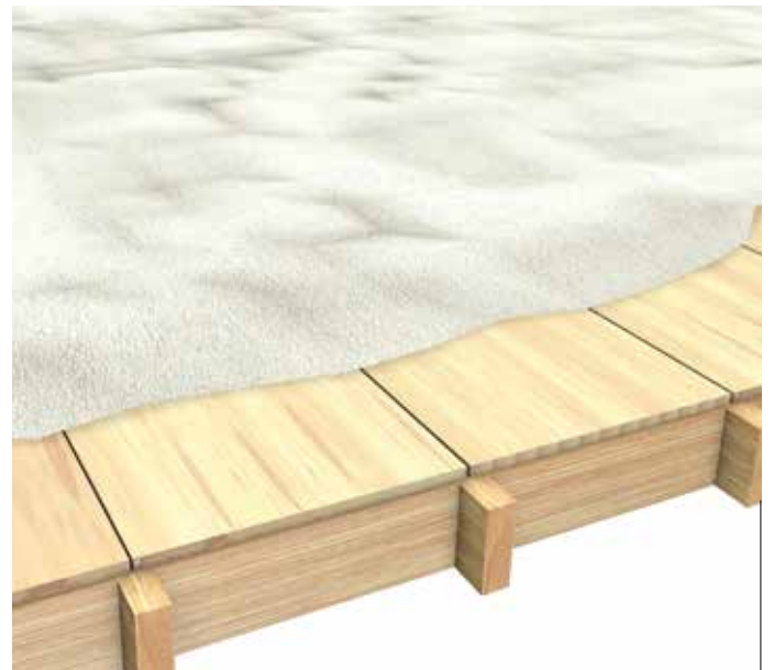
Isolamento mediante insufflaggio su struttura in legno