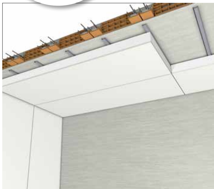
Isolamento interno su soffitto - versione K50, K100, K150