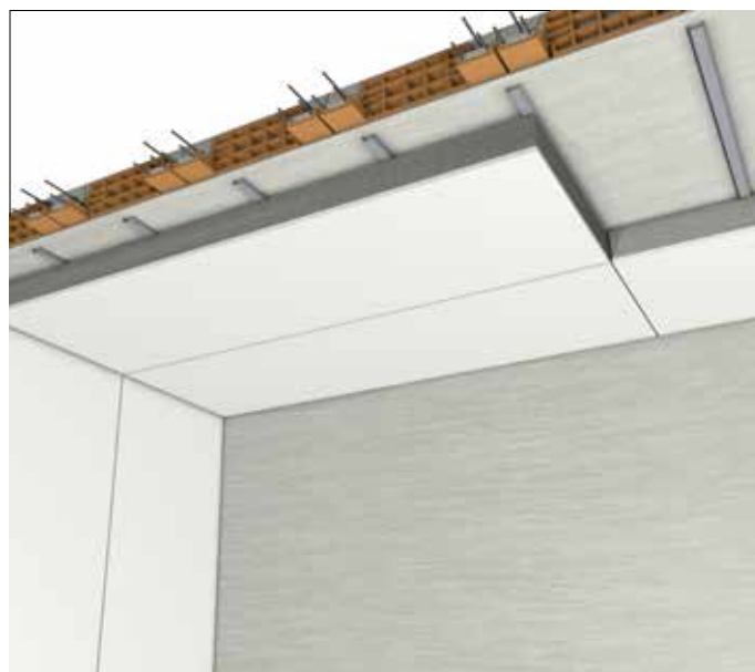
Isolamento interno su soffitto - versione G031