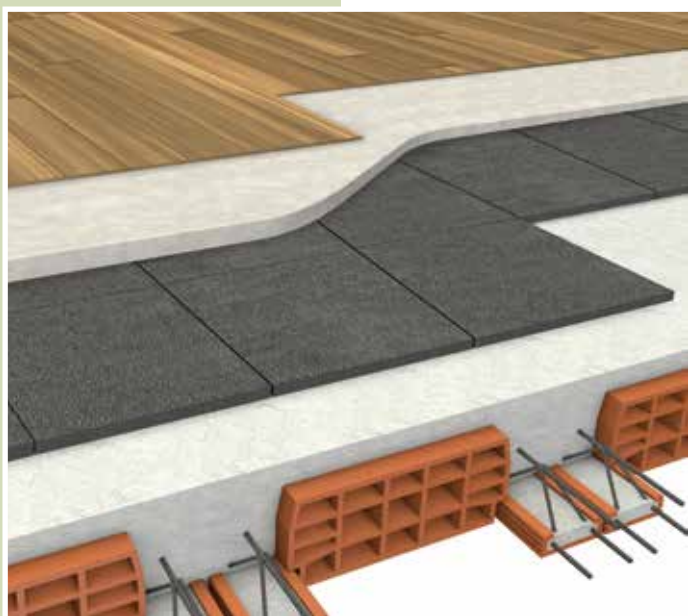
Isolamento del solaio su spazi riscaldati con struttura in latero-cemento