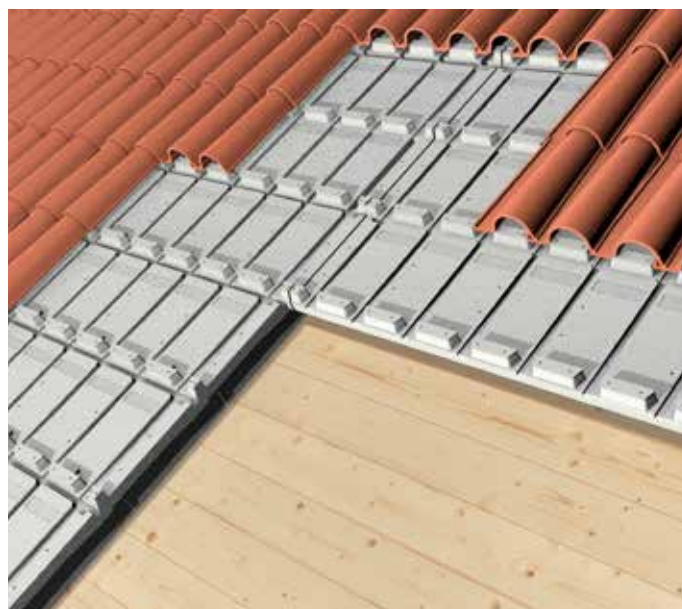
Isolamento per copertura a falda inclinata con struttura in legno