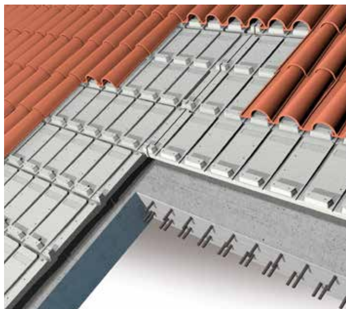
Isolamento per copertura a falda inclinata con struttura in calcestruzzo