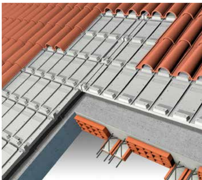
Isolamento per copertura a falda inclinata con struttura in latero-cemento